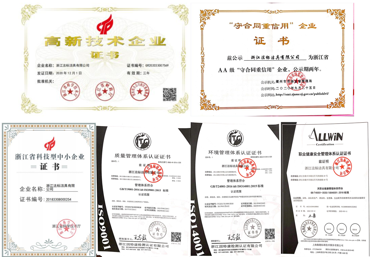
图 1-1 公司荣誉展示

法标洁具站在“洁具家居化”的高度做洁具，法标洁具在产品结构不断完善和细化。以“人性、简洁、时尚、实用”为产品开发理念，在色彩、性能、配套等方面不断的创新，得到了广大消费者的高度认可，06年被评为“中国著名品牌”，获得“中国洁具行业 20 质量过硬放心品牌”、“国家权威检测·质量合格产品”等殊荣，并获得多项产品专利。法标洁具的中外优秀设计师团队凭借强大的研发能力全新研发打造，形成新古典、简欧、仿古、现代、后现代等多种风格的洁具产品，给洁具赋予家居的灵魂。现拥有法兰西系列、戴高乐系列、8000 系列、9000 系列、600 系列、500 系列、2008 系列及 009 系列等系列浴室柜；浴缸有东方丽人、路易、老爷车、亚瑟王、安冬妮等各系列的功能缸、冲浪缸、动力缸；淋浴房有各种款式、各种型号的整体房、蒸汽房、简易房；有各种型号坐便、智能坐便；三十多款花洒及上百款五金配件。“法标”正是完美的产品品质及贴心的售后服务，而成为行业新的风向标。