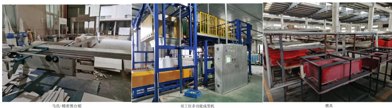
图 1-4 公司设备展示

公司结合自身实际，建立了完善的质量管理体系，贯彻以原料稳定、工艺稳定、操作稳定最终确保质量稳定的方针。公司配备了木工镂铣机、卧式双端海绵砂光机、变频液压式冷压机、半自动捆扎机、精密裁板锯、单头直榫开榫机、平立砂带机、马氏木工镂铣机等先进生产设备和可见分光光度计、带表卡尺、线纹钢直角尺、钢卷尺、盐雾试验机、高低温试验箱等必要的检测设备，为产品质量以及售后服务提供了有力保障。